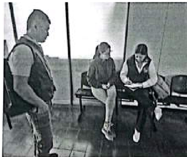
Evidencia fotográfica reunión Alcaldía municipio Sevilla