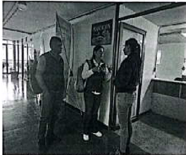
Evidencia fotográfica reunión Alcaldía municipio Sevilla