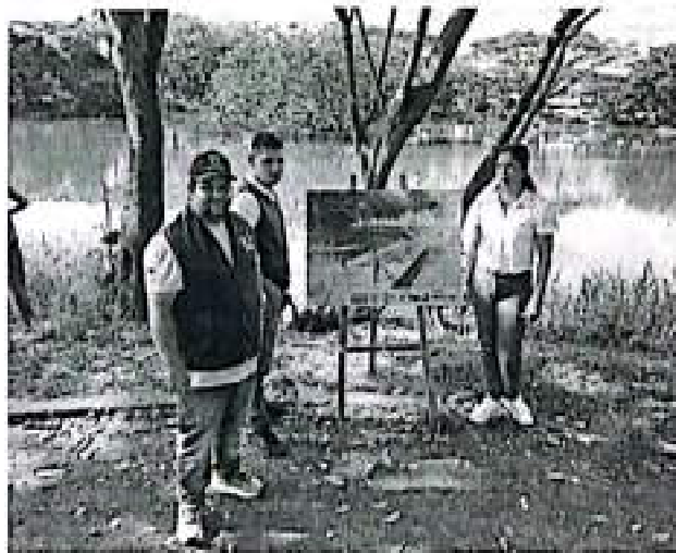
Acompañamiento a Gobernadora en recorrido Lago Chicote Tuluá

ACTIVIDAD 2. Diseñar materiales educativos y metodologías participativas que integren conocimiento técnico, cultural y comunitario sobre la biodiversidad y los ecosistemas estratégicos del Valle del Cauca.