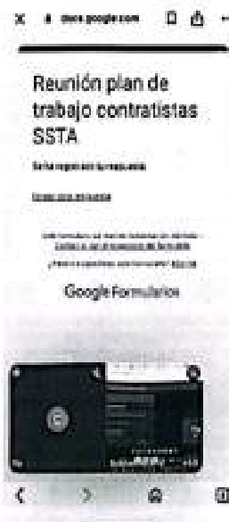
Evidencia asistencia reunión trabajo SSTA