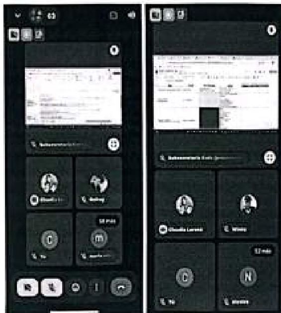
Evidencia asistencia reunión trabajo SSTA