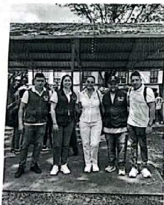
Asistencia actividad Gobernadora en coliseo ferias Tuluá