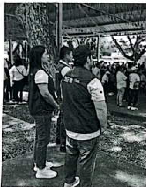
Asistencia actividad Gobernadora en coliseo ferias Tuluá