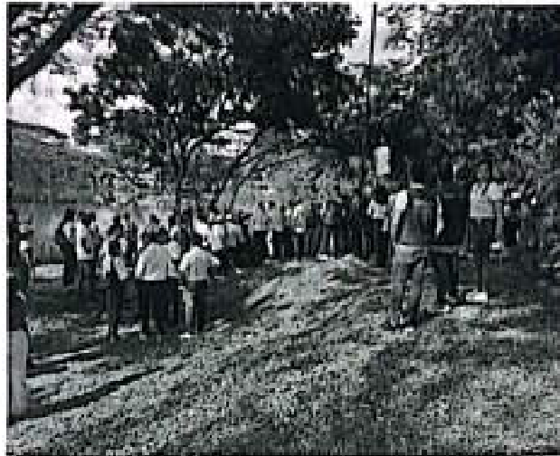
Acompañamiento a Gobernadora en recorrido Lago Chicote Tuluá