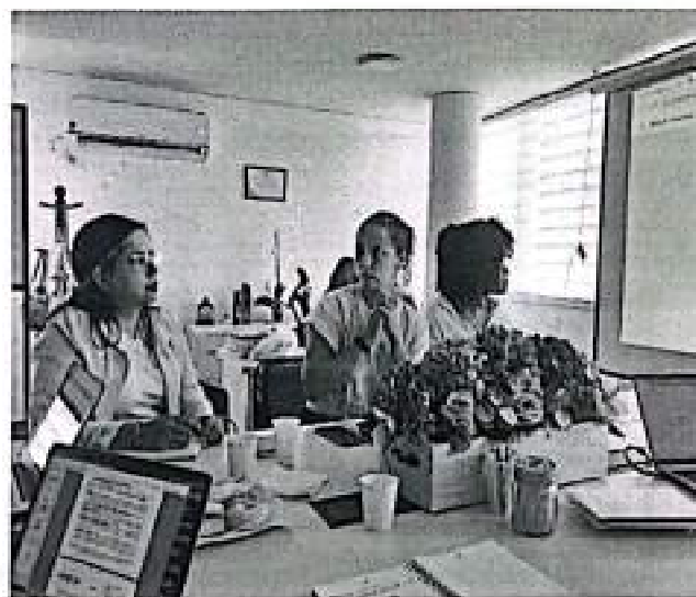
Evidencia fotográfica reunión seguimiento convenio INCIVA