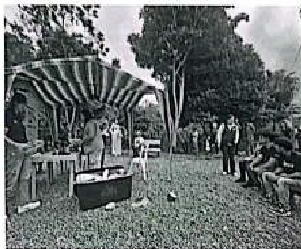
Evidencia fotográfica apoyo taller INCIVA municipio Sevilla

municipio de Sevilla con la naturaleza y el patrimonio natural. En esta actividad se enseñó a la comunidad sobre la fauna nativa del Valle del Cauca. Utilizando muestras reales y dando a conocer sobre los hábitos de vida de diversas especies a través de la observación de sus características anatómicas.