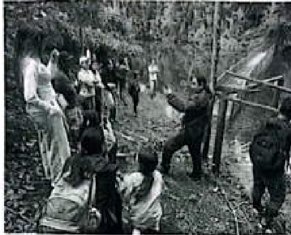
Participación jornada Humedal Sinclusa Sevilla