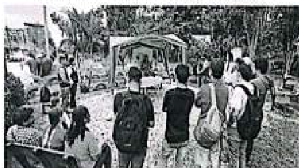
Evidencia fotográfica apoyo taller INCIVA municipio Sevilla