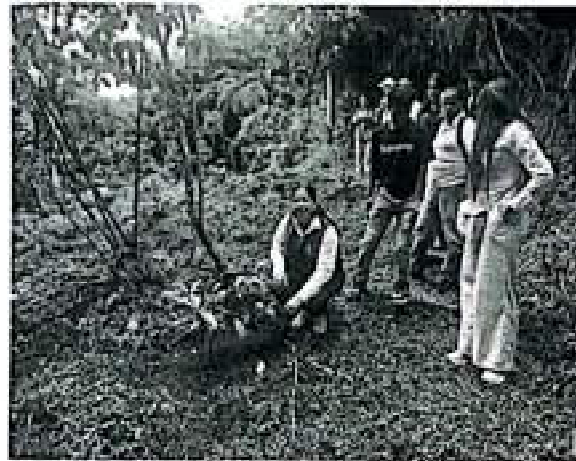
Participación jornada Humedal Siracusa Sevilla