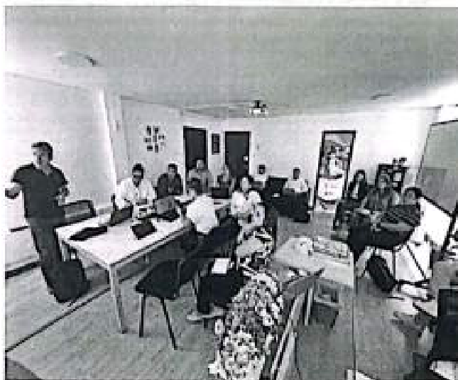
Evidencia fotográfica reunión seguimiento convenio INCIVA